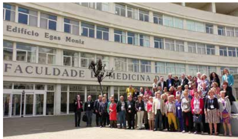
Les membres de l'ECH devant la faculté de Médecine de Lisbonne