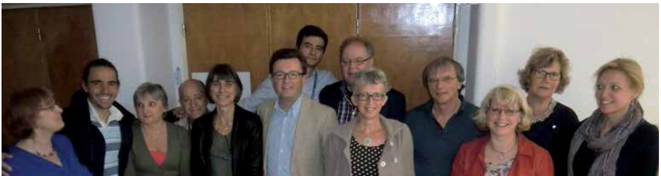
Les membres du conseil de l'ECH avec des représentants du LIMMIT et de l'AMPHSH.

Ce projet prometteur a été abordé durant les réunions entre le conseil de l'ECH et les représentants des LIMMIT, AMPHSH et de l'Ordre des Médecins portugais (Ordem dos Médicos).